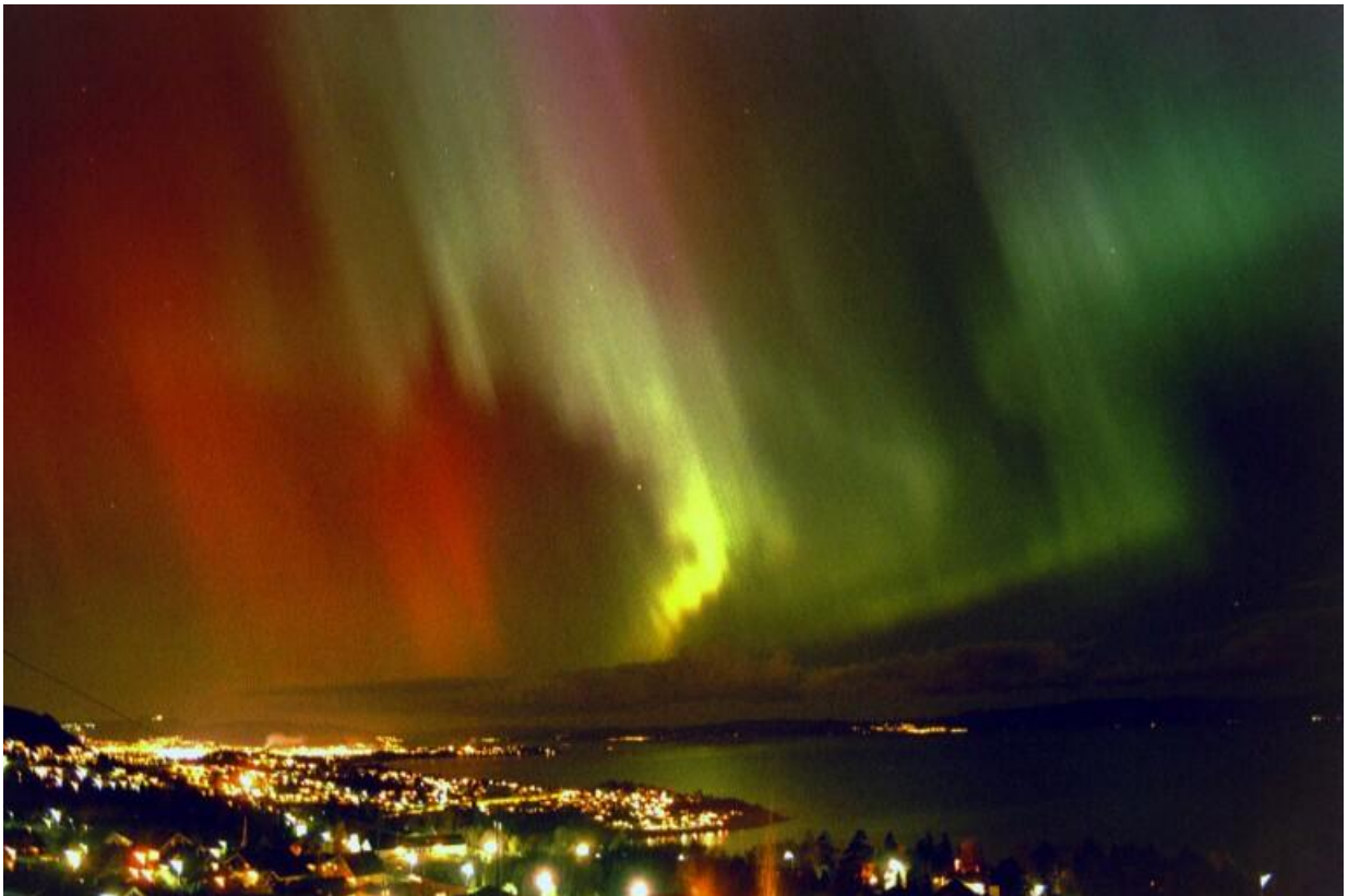
Trondheim i nordlys sett fra Vikhammeråsen av Bernhard