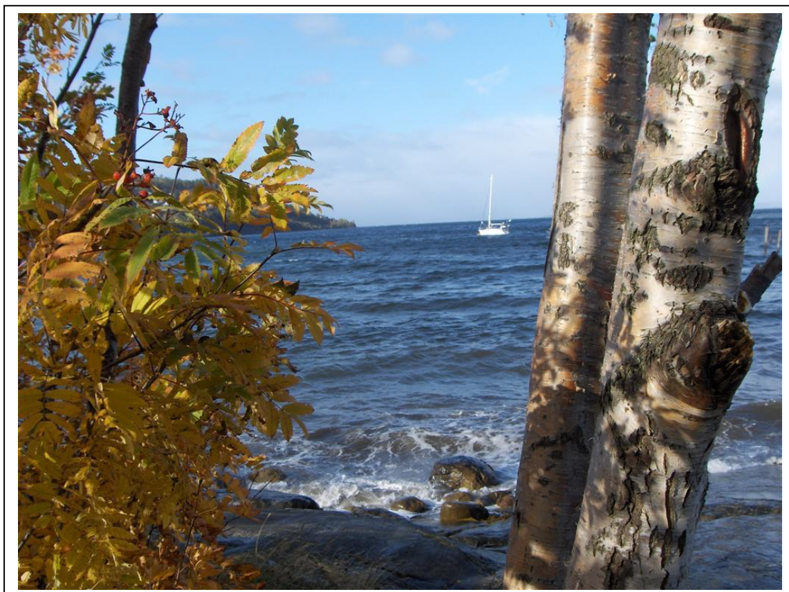
Malvikbukta av Bernhard