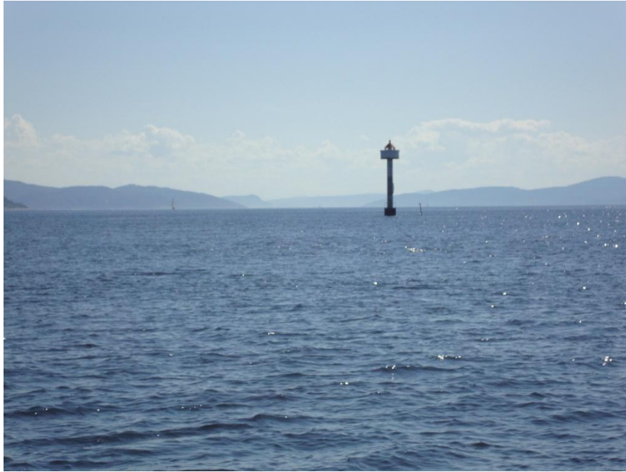
Navigare necesse est