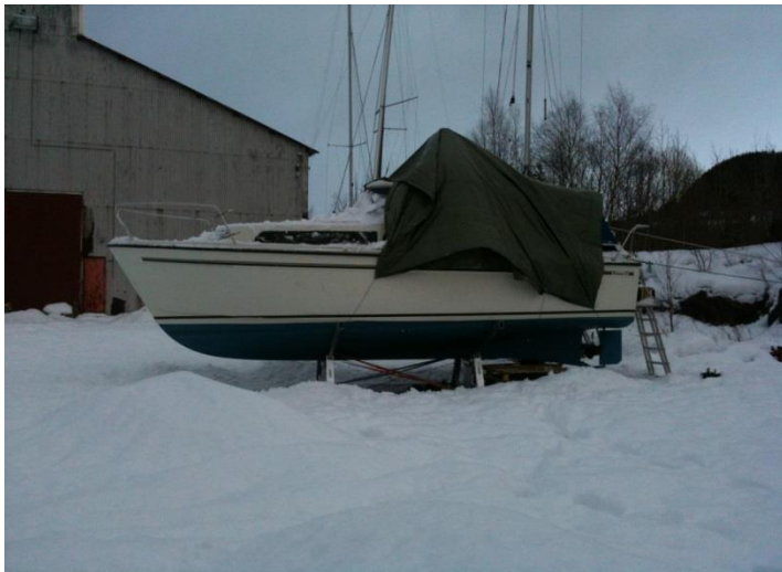
Vinteropplag i Muruvika med en amatørmessig presentering

Da jeg kjøpte båten for tre år siden var jeg klar over at motoren sukket på siste verset. En inspeksjon før kjøpet avslørte at Volvo Penta MD 17 hadde lagt sine beste dager bak seg - vel likevel håpet jeg at jeg kunne holde liv i stakkaren et par år til. Slik skulle det ikke gå men før jeg kommer så langt tenkte jeg å gi dere starten på båtlivet i Trondheimsfjorden.