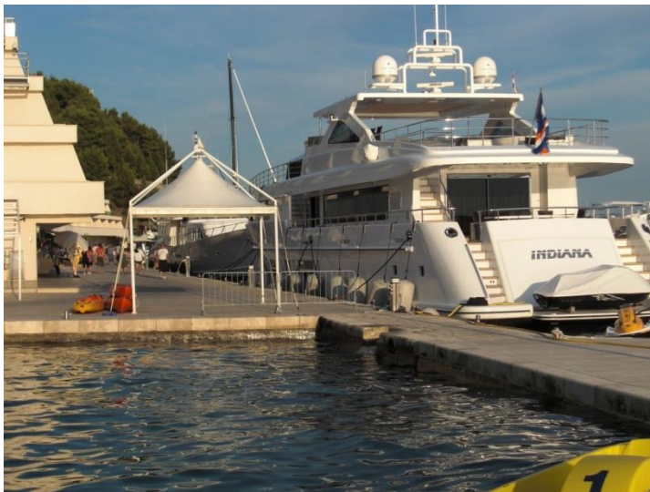
Ferie i Kroatia. Dette kunne vært noe å ha..

Vel, før sommeren ble det besluttet at oppløft nær moloen er for risikabelt og at båten har det best på sjøen. Båt på land? = Bobil? Vår og sommer var fin og vi hadde mange dagsturer ut på fjorden. Koste oss med sol og varme. Forresten, jolla er alltid med. Jeg føler det som en ekstra sikkerhet i tilfelle noe skulle skje. Sikkerhet er viktig synes jeg. Vel, det var en digresjon, men en viktig en.