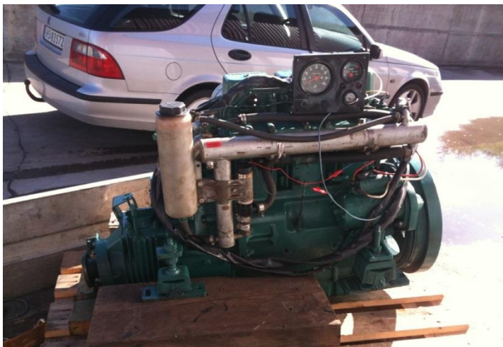
Nymotorn – ser litt bedre ut

Denne sommeren var ikke akkurat av de som huskes best for fint vær – iallfall ikke da vi var hjemme. Derfor ble det ikke mange turene ut på sjøen. Høsten ble fin og junior og jeg fikk noen fine fisketurer med en bra fangst av storsei (bare vi fikk snøret under den forbaskede makrellen). MEN da merka vi at "nypentaen" fikk feber fort.