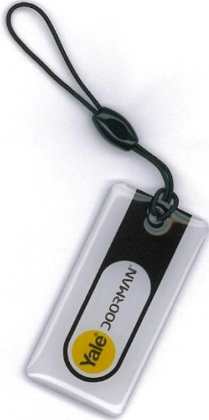
III. foto Yale. Nøkkeltag

Som de fleste av dere har oppdaget, begynner vi å få problem med nøkkelkortene i dørlåsene. Gjelder grinda og spesielt til vaktbua.