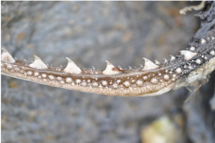
Halen av ei kloskate