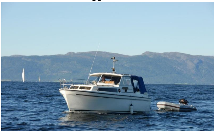
Bildet tatt utenfor Munkholmen på tur fra Børsa til Hommelvik.

Dette er nok et landligge som flere husker. Siden opplagsplassen i Hommelvik skulle