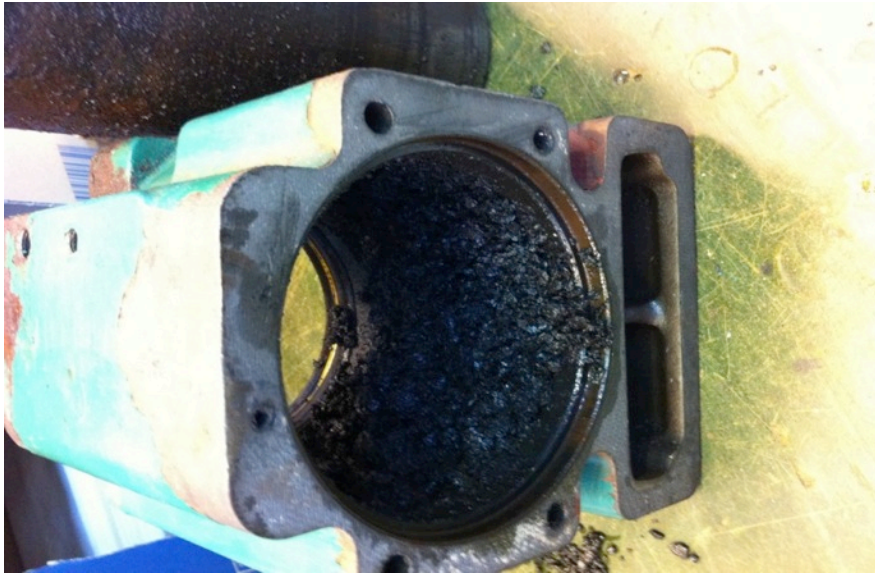
Vannkappe med sylindreforing fjernet – sylinder nummer en. Her er det mye godsaker.

Som dere ser av bildet så har det ikke vært mye vanngjennomstrømning her! Ikke rart feberer har tatt tak i det grønne beistet. Det er ingen bønn, resten av klumpen må opp til rens og han fyren som solgte meg vidunderet har nok bare montert en martec på motoren og håvet inn de 20 lappene!