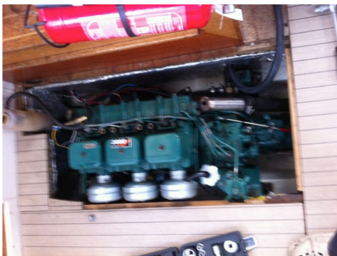
Nå er det like før deksel, manifold og resten av det som stikker ut blir demontert.

Før jeg kom til godsakene måtte jeg imidlertid fjerne martec'en, manifolden og løsne dieslrørene. Dette var gammelt nytt og gikk som smurt i løpet av et kvarter. Underveis bestemte jeg at martec'en og manifoilen skulle få en overhaling med det samme. Men det fikk vente – først skulle toppene av og jeg bestemte meg for å sjekke sylindernummer en først og la de andre to hestene(sylindrene) være i fred i første omgang. De fleste av dere vet at latskap er den største motivasjonen til oppfinnsomhet og der er jeg - lat mener jeg. Som en følge av det håper jeg jo på at han som solgte meg vidunderet var en ærlig fyr og hadde demontert og overhålt til en skala som ligner på atomært nivå før jeg fikk æren av å overta den. Martec er jo kjent for å være underdimensjonert men det får da være måte på..... Etter å ha fjerna dekslet på sylindernummer en gikk jeg igang med mutrene som holdt topplokket på plass. Herrejemeni, her var det bare å sprinte opp til bilen og hente forlengeren jeg bruker når jeg bytter dekk. Minn meg på at jeg må sjekke hvilket moment som disse skal skrues fast med men dette var tøffe greier. Uansett de kom av uten at boltene ble nevneverdig skadd. I min naivitet trodde jeg at da var toppen løs og at det bare var å løfte den vekk før jeg løftet av sylindreforing og vannkappe. Vel og merke hadde jeg fjernet ventilløfterne før dette. Slik var det, som noen av dere sikkert har erfart ikke. Det var jo et oljerør i veien!