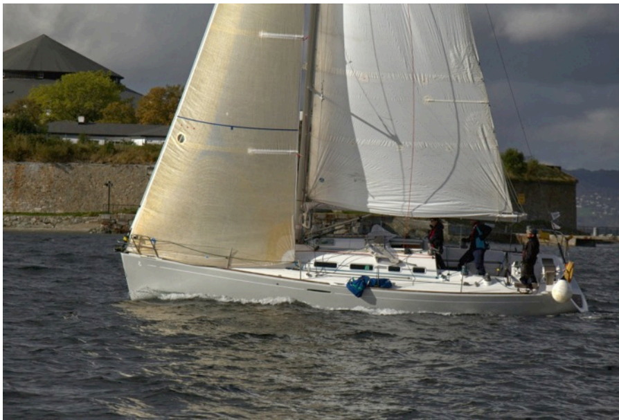
"Mamma Mia" Kai sin båt.