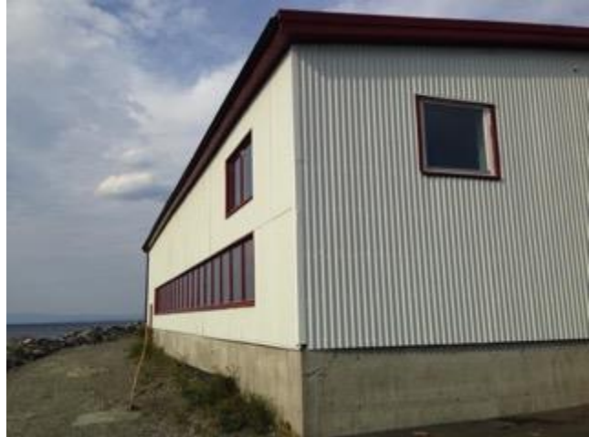
Hallen før riving.

Trist sak, men noen ganger må en bare akseptere fakta. Bilder tatt fredag 04.09.15.