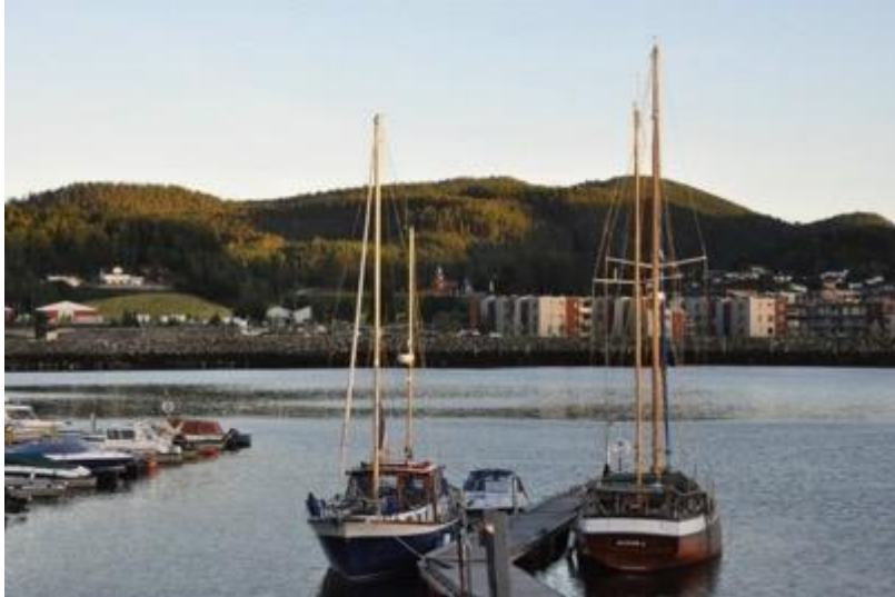
To vakre skuter. Finnsailerer til venstre.

Mange observerte en vakker blå Finsailer på gjestebrygga og lurte på hvem som hadde vunnet i Lotto nå. Dette var en ung mann fra Skien som skal studere samfunnsfag ved NTNU. Målet er å bli lektor om fem år. I studietiden var hans plan å bo i båten som er fra 1979 og kjøpt for 340 000 kroner i