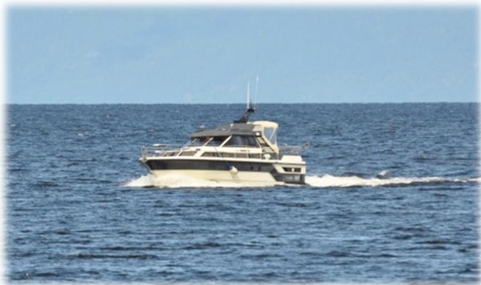
Inn til havn