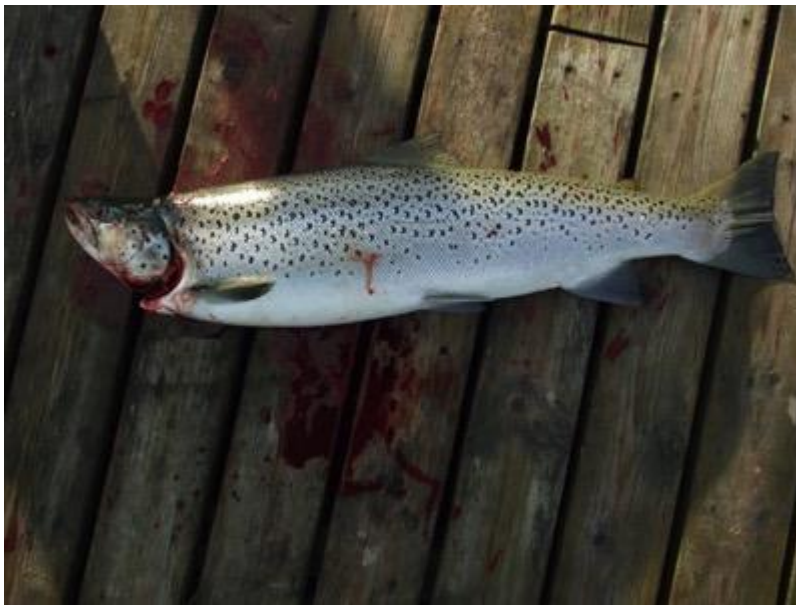
Hunnfisk ca 3 år

Sjøørret ( Salmo trutta trutta ) regnes som en underart av ørret ( Salmo trutta ), men klassifiseringen av denne fisken er fortsatt ikke endelig avklart.