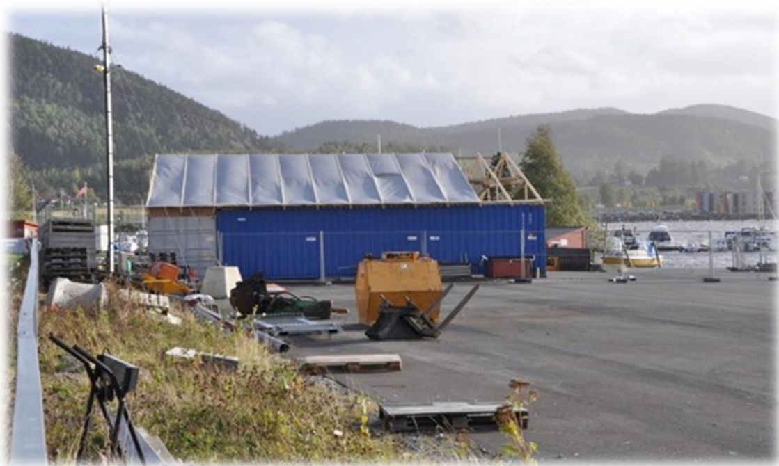
Ny-hallen tar form

Vaktliste for 2016. Hvert enkelt medlem er selv ansvarlig for å holde rede på når det skal utføres pålagte oppgaver som kaffeservering og ukevakt.