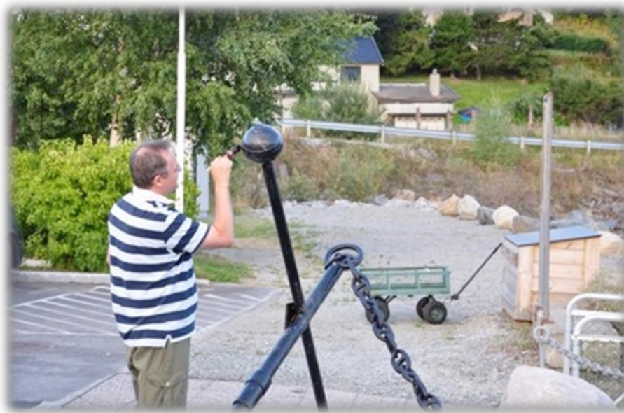
"Proff" maler