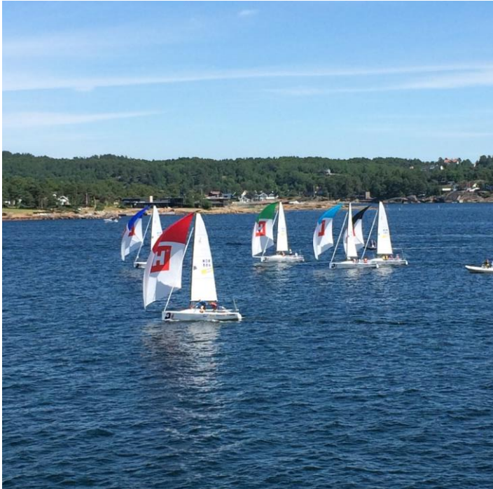
På dette bildet fra Sandefjord er vi (MSS) i mørkeblå båt og vi vant dette racet. (Fra Sandefjord)

Norges seilforbund har kjøpt inn fem J-70 seilbåter som totalt 30 ulike seilforeninger