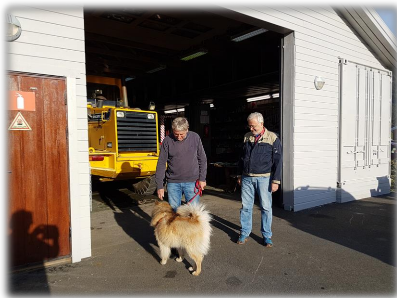
Firbeint besøk på dugnad