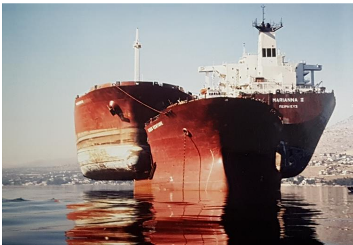
Transport av tankbåt til Korea