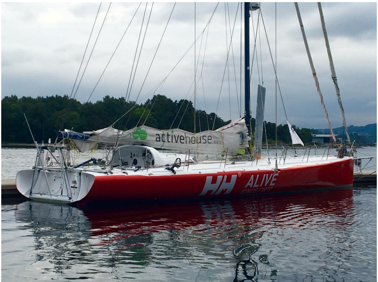
Seilbåten «Galactic Viking» som vi seiler fra Oslo til Puerto Rico

Som dere kanskje skjønner av det forrige avsnittet i dette innlegget så har «Lederen» nå begynt å drømme seg bort. Det har sine naturlige årsaker, jeg skal ut på en lengre seilas og gleder meg veldig. Midt i oktober seiler jeg med en 60 fots seilbåt ut fra Oslo, ned til Nord-Spania, videre sørover til Grand Canaria og Cape Verde øyene, så over Atlanterhavet til St. Lucia øyene og videre til Puerto Rico. Det blir en over 2 måneder seiltur med vær-forhold fra mulige høst-stormer i Nordsjøen og over Biscaya-bukten til forhåpentligvis mer sommerlige forhold i Karibia. Båten vi seiler med er en såkalt «Open 60», dette er seilsporsens svar på Formula 1 – en båt som brukes i regatta «raskest rundt jorda». Båten har vært oppe i 37 knop i Sørishavet. Jeg tror det blir en spennende tur og er hjemme igjen til jul.